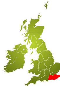
South East Coast