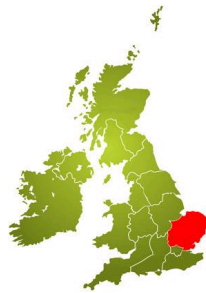
East of England